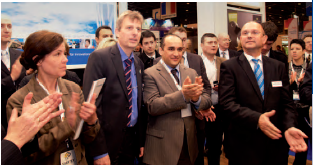
Internationale Beteiligung beim Business Frühstück auf dem Gemeinschaftsstand des Enterprise Europe Network und Cluster Neue Werkstoffe während der JEC Composites Show in Paris