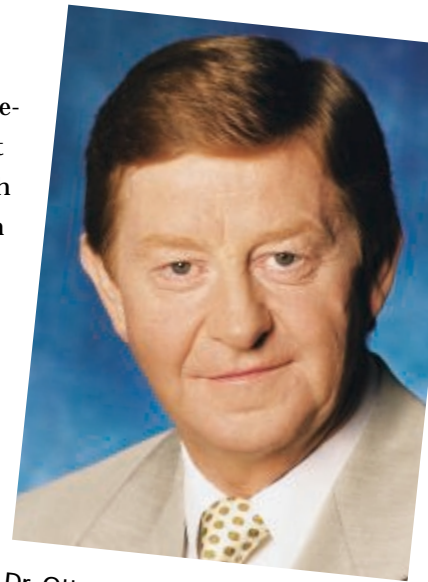
Dr. Otto Wiesheu, Bayerischer Staatsminister für Wirtschaft, Verkehr und Technologie

Um den Finanzierungsproblemen des Mittelstandes effizient begegnen zu können, sind auch wirtschaftspolitische, vor allem steuerliche Maßnahmen notwendig; hier ist in erster Linie die Bundesregierung gefordert. Bayern wird sich auch in Zukunft aktiv für eine Verbesserung der mittelständischen Finanzierungsbedingungen einsetzen.«